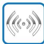
2.4 GHz 无线技术