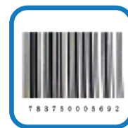
兼容各类 一维条码