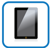
不刮伤 & 不留指纹